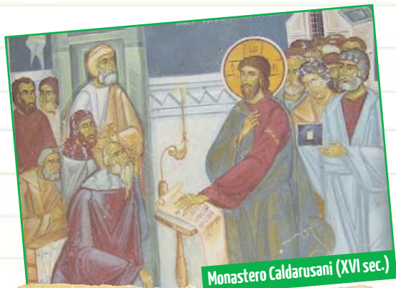
Monastero Caldarusani (XVI sec.)