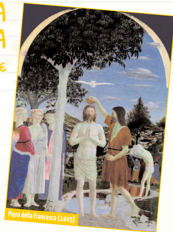
Piero della Francesca (1445)

Ancora una volta Dio scambussola gli schemi: questa "rivelazione" accade quando è in fila con tutti gli altri uomini, senza nessuna distinzione.