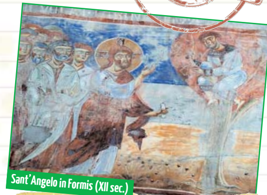
Sant'Angelo in Formis (XII sec.)

Cerca di non accumulare cose, regala ciò che hai in più.