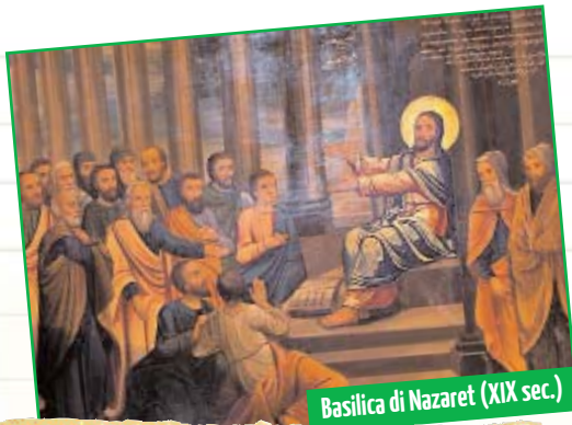
Basilica di Nazaret (XIX sec.)