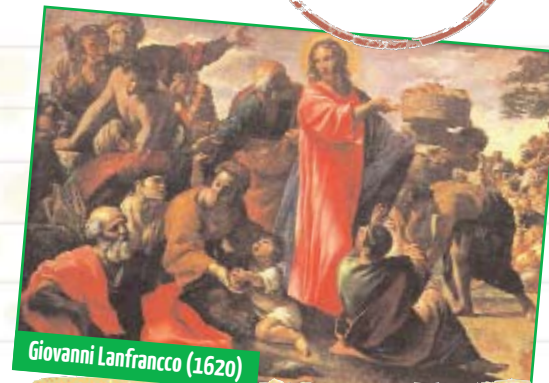
Giovanni Lanfranco (1620)

Occhio ai compagni e amici bisognosi: a loro puoi dare il centuplo e poi ricevere altrettanto!