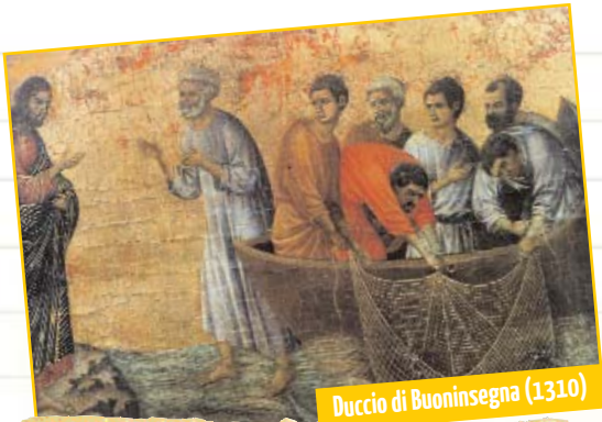
Duccio di Buoninsegna (1310)