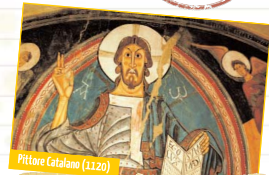
Pittore Catalano (1120)

Stai attento a non cadere nel buio dei peccati: invidia, egocentrismo e possesso rischiano di farti camminare al buio.