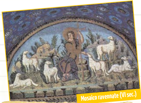
Mosaico ravennate (VI sec.)