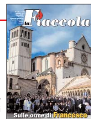
Copertina: i seminaristi ad Assisi.